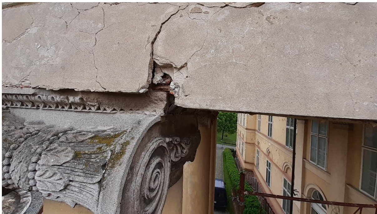
obr.03 porucha pred sondážou – poloha detail „A“