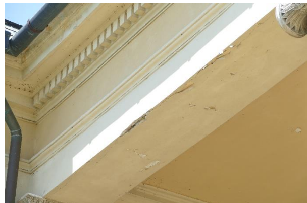
obr.12 detail z obr.11

Na základe požiadavky správcu objektu som vykonal technickú obhliadku stavu dreveného prekladu architrávu – spodnej časti kladia pod murovanou časťou tympanonu – vlysom.