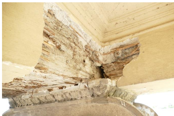
obr.06 detail z obr.05