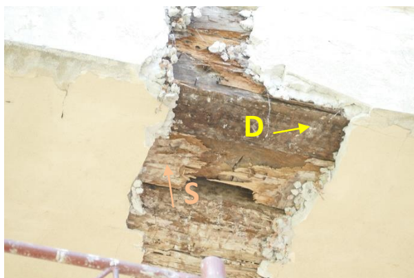
obr.07 detail „B“ z obr.02